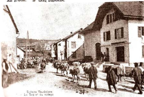
Scènes Valdaisiennes Le Depot du village

Les Crételles au début du siècle * chez Dollion